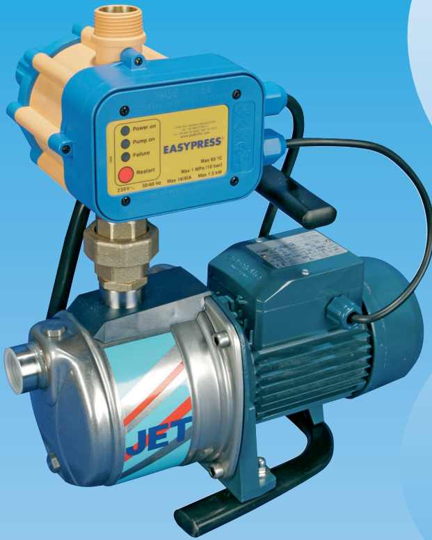
ISKU-JET 2 RS