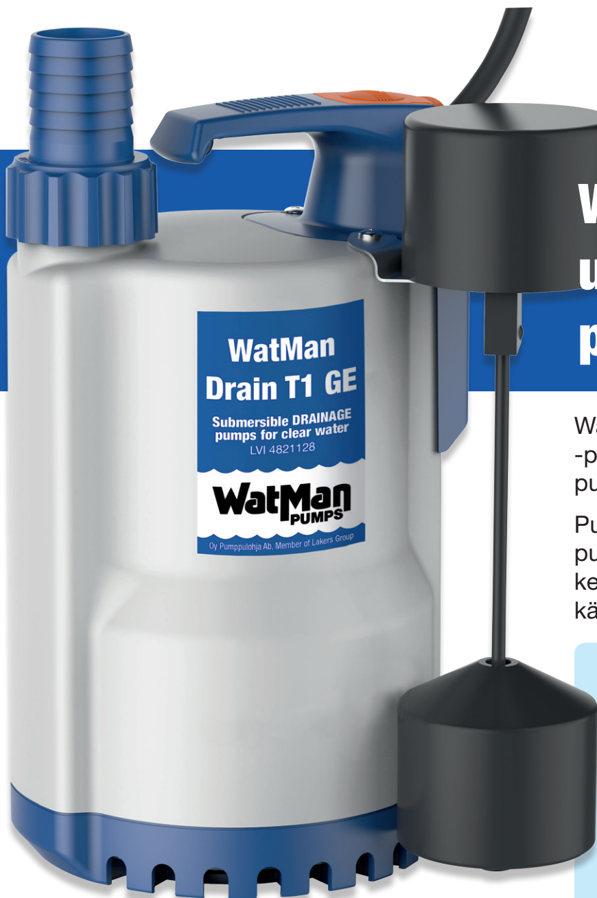
Tehokäyrät WatMan Drain T1 GE ja T3 GE