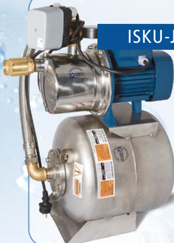
ISKU-Jet 1/25 RP